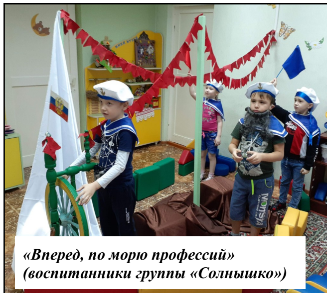
«Вперед, по морю профессий» (воспитанники группы «Солнышко»)

Пальчиковые игры по теме «Профессии» стр.7