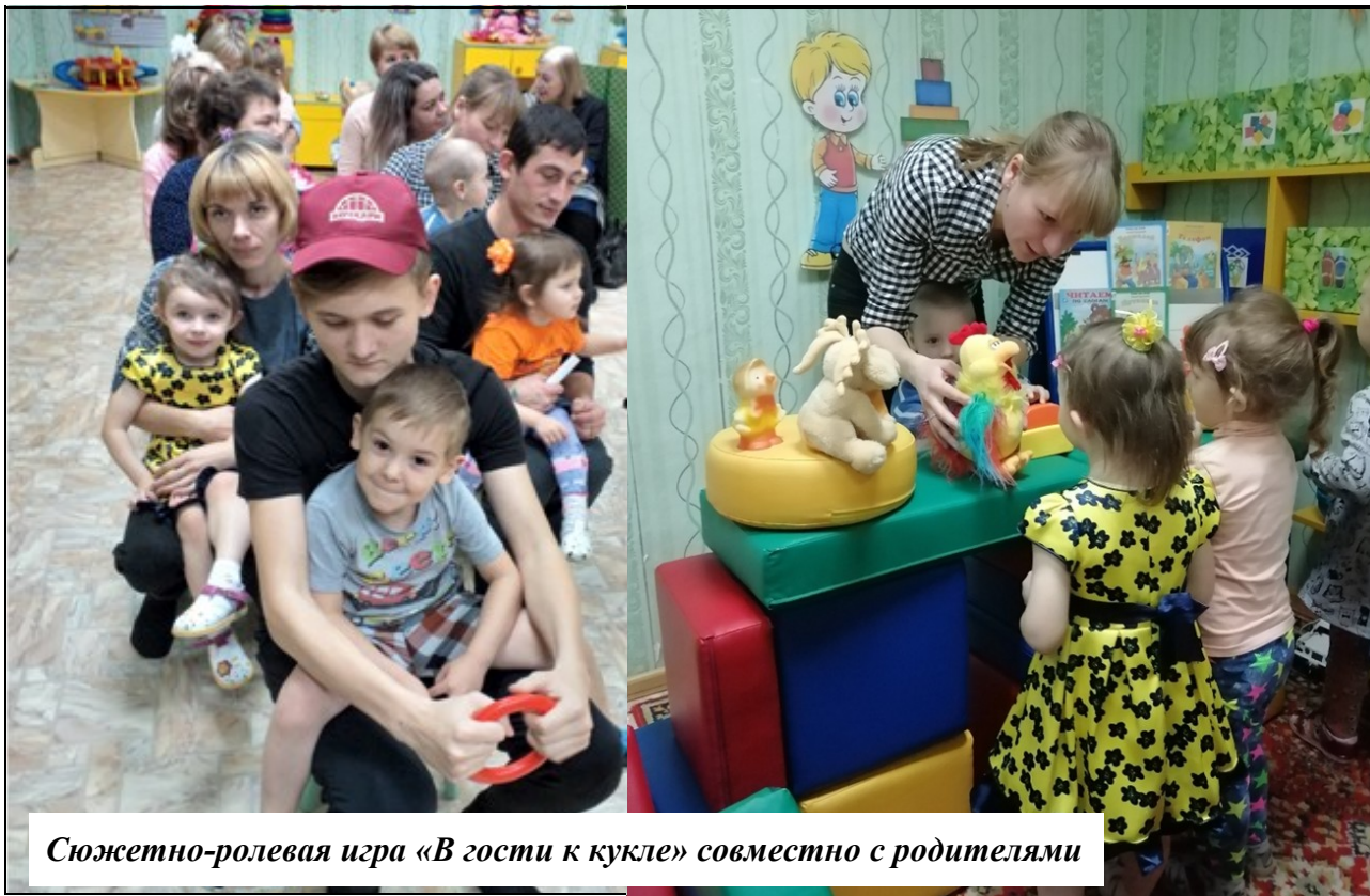
Сюжетно-ролевая игра «В гости к кукле» совместно с родителями