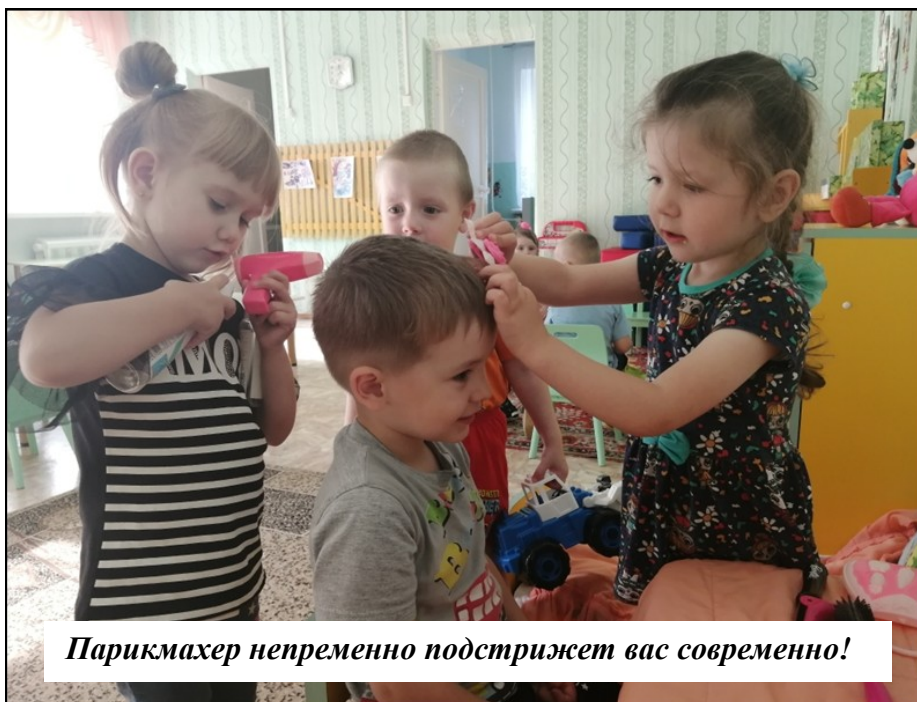
Парикмахер непременно подстрижет вас современно!

Дидактические игры: «Знаю все профессии», «Кому нужны эти вещи для рабо-