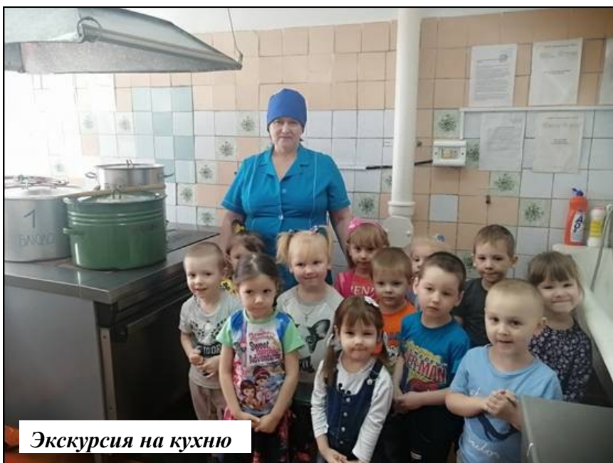
Экскурсия на кухню

- дать детям начальные и максимально разнообразные представления о профессии сотрудников детского сада, о простейших трудовых операциях и механизмах, в том числе и профессиях своих родителей (место работы родителей, значимость их труда, гордость и уважение к труду своих родителей);